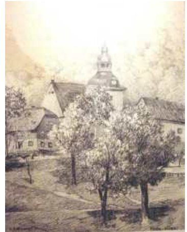
Die Kirche Glösa 1831

Nach dem Ende des II. Weltkrieges schöpften die Menschen große Hoffnung auf ein friedvolles Zusammenleben ohne Krieg in Europa und der Welt.